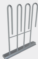
Suporte para balão