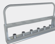
Suporte para traqueias (até 36 unidades)