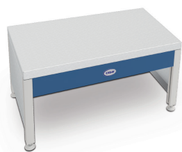
Mesa para Lavadora Ultrassônica