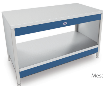
Mesa de Trabalho